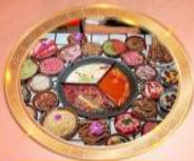
บุฟเฟต์หม้อไฟลงซิ่ง