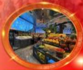
มือพิเศษ บุฟเฟต์นานาชาติ