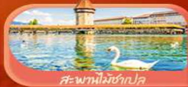
สะพานไม้ซังปก

Highlight เยือนหมู่บ้านแสนสวยเซอร์แมท เช็กอินศาลาไทยสุดงามที่โลซาน เที่ยวลูเซิร์น ชมสะพานไม้ซังและอนุสาวรีย์สิงโต ซาลี แพลสซิ่ง ชมประติมากรรม The Fork และปราสาทซิลลองริมทะเลสาบ เยือนมิลาน มหาวิหารดูโอโม เกียวเวนิส เมืองลอยน้ำสุดโรแมนติก อินกับรักอมตะที่บ้านจูเลียต และช้อปปิ้งจุใจที่ Serravalle Outlet