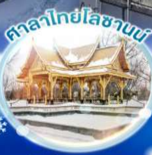
ศาลาไทยโลซานน์