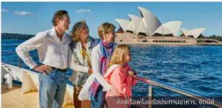
ล่องเรือพร้อมรับประทานอาหาร, ซิดนีย์