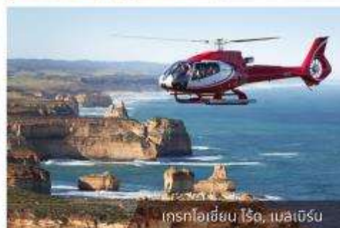
เกรทโอเชียน โรด, เมลเบิร์น