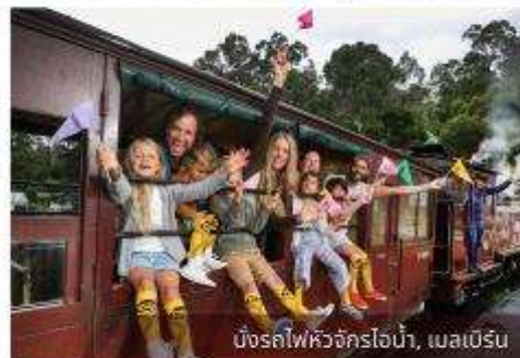
บึงรถไฟจักรไอน้ำ, เมลเบิร์น