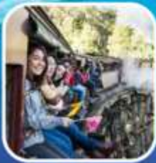
รถไฟจักรไอน้ำโบราณ