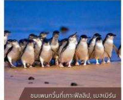
ชมเพนกวินที่เกาะฟิลลิป, เมลเบิร์น