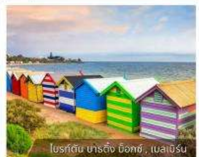
โบสถ์ต้น ชาร์ลิ่ง บ็อกซ์, เมลเบิร์น