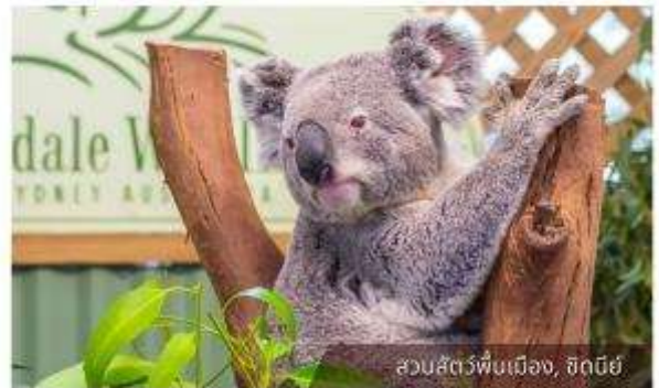
สวนสัตว์พื้นเมือง, ซิดนีย์