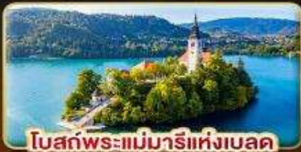
โบสถ์พระแม่มารีย์แห่งเบลด