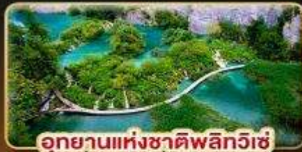
อุทยานแห่งชาติพลิตวิเช