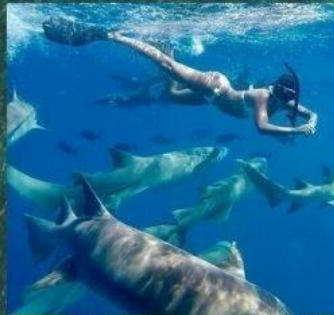
** Nurse Shark Snorkeling