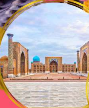
จัตุรัสเรอิสถาน